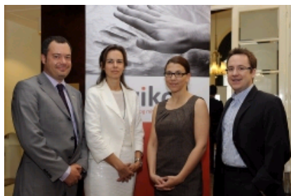
© Leo Hagen Ertler, Karmasin, Fink, Kaufmann (v. l.)

Zum ersten Mal wurden Konsumenten zum Thema Nachhaltigkeit und Immobilien befragt. Die Ergebnisse der Studie sind verblüffend und mitunter erschreckend.